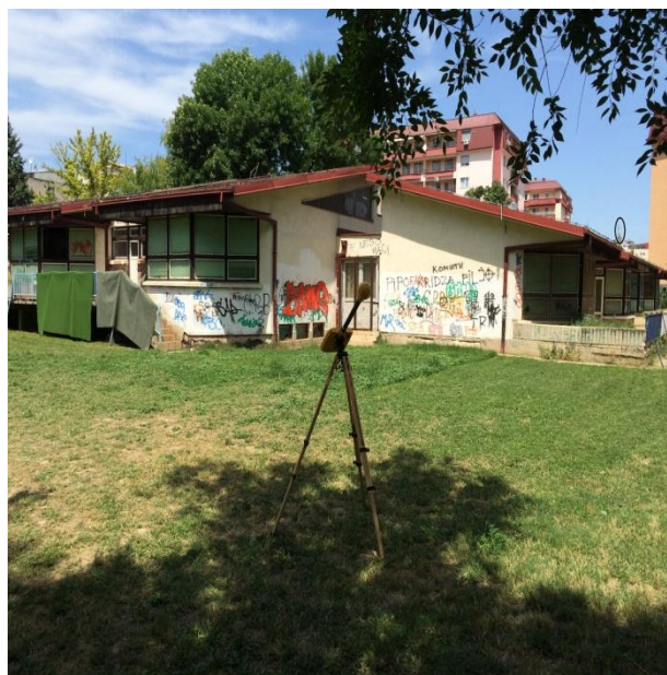
Сл.3 Поглед од дворот на градинката кон базните станици