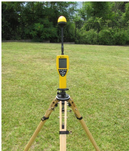
Сл.1 : Narda NBM 550

При мерењето користена е калибрирана опрема од Narda и тоа широкопојасен инструмент за мерење на електромагнетно зрачење NBM 550 и фреквентно селективен инструмент за мерење електромагнетно зрачење SRM 3006 со соодветни изотропни антени во зависност фреквенциите на електромагнетното зрачење.