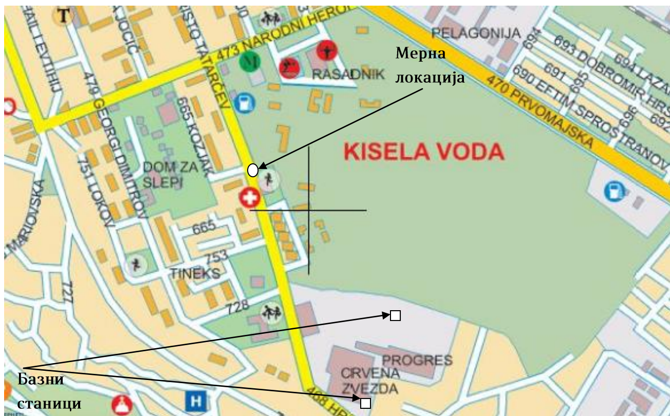
Сл. 4 Мапа на локацијата