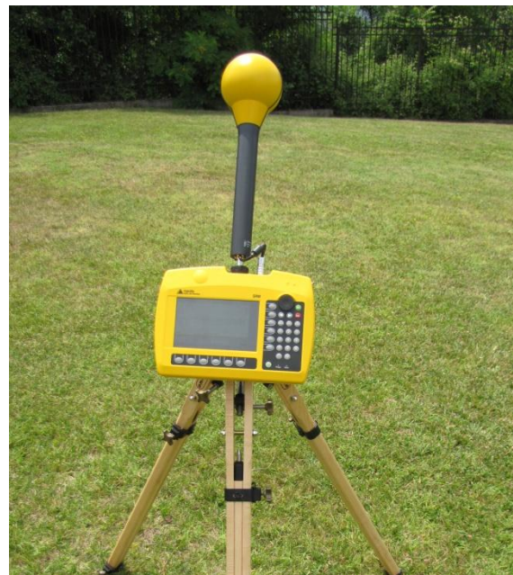
Сл.2 : Narda SRM 3006